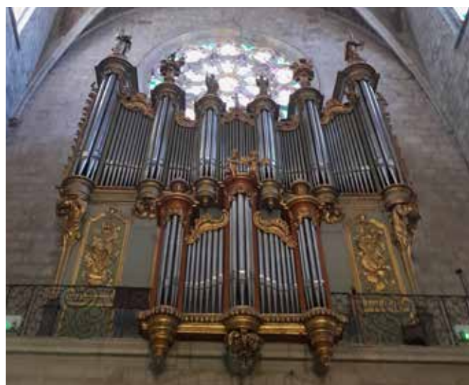
Des animations possibles avec des partenaires de la ville tel Les Amis des Orgues

Le programme définitif sera confirmé prochainement.