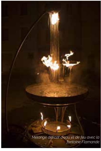
Mélange délicat d'eau et de feu avec la fontaine Flamande