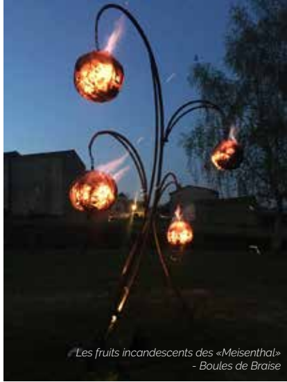
Les fruits incandescents des «Meisenthal» - Boules de Braise