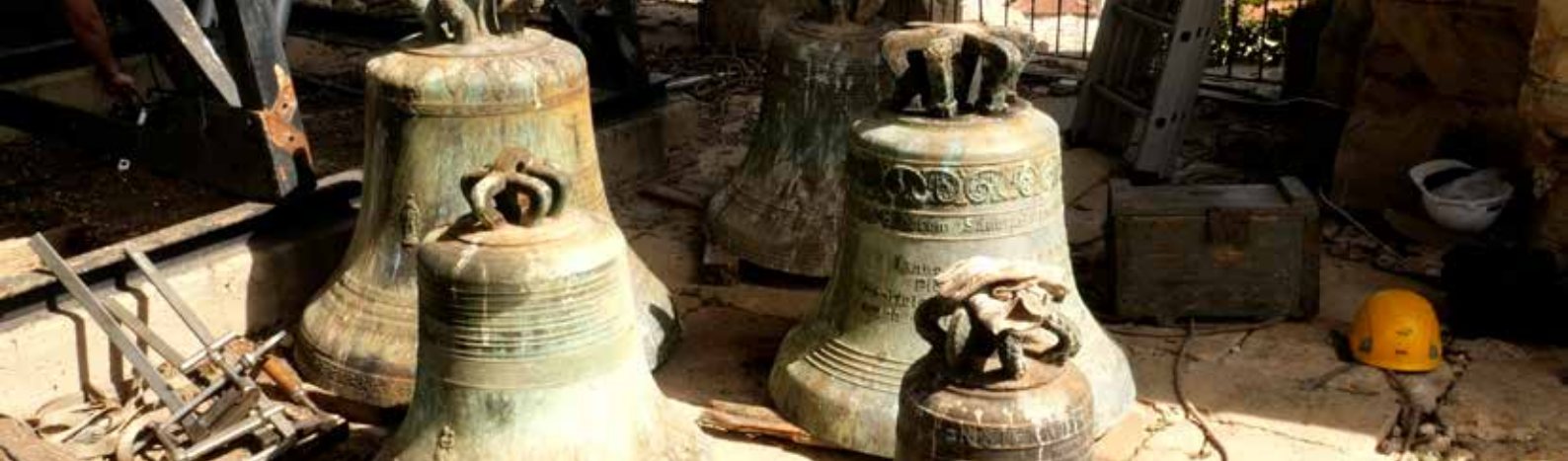
Les cloches de la Cathédrale le jour du démontage du beffroi