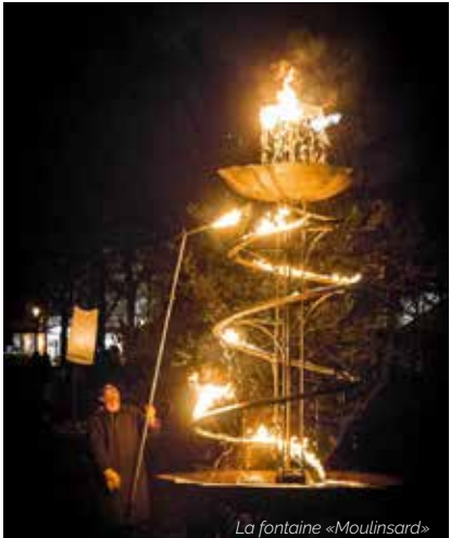
La fontaine «Moulinard»