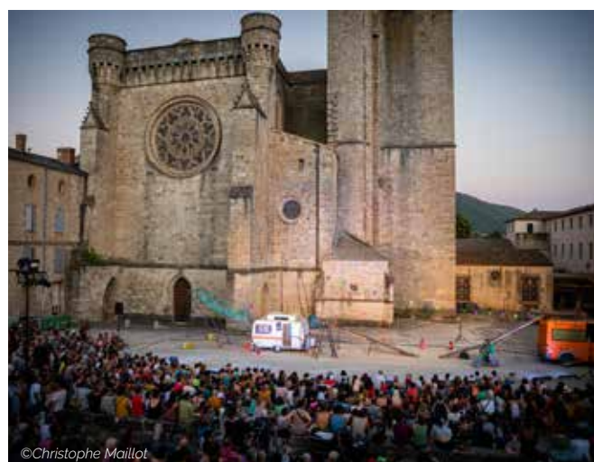
Festival Résurgence 2022. la Cie Toi d'Abord devant la Cathédrale