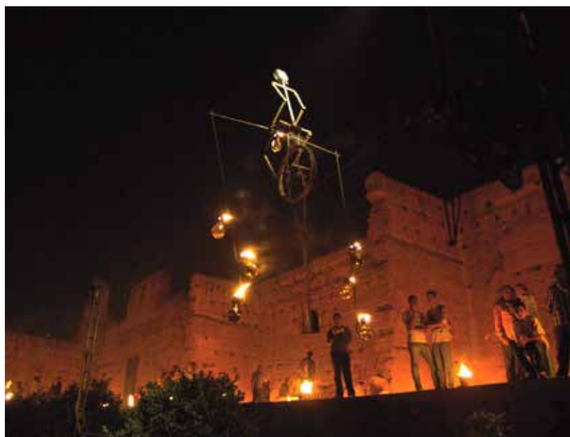
Rencontre avec le mouvement perpétuel du « Funambrûle »