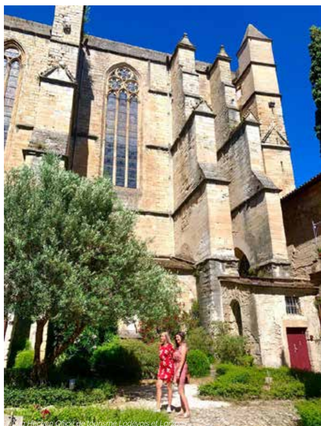
à la Hecken Office de tourisme Lodévois et Larzac Organisation de visites guidées avec des guides conférenciers