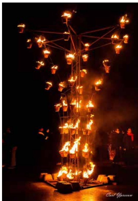
Les « Tulipes de Feu »