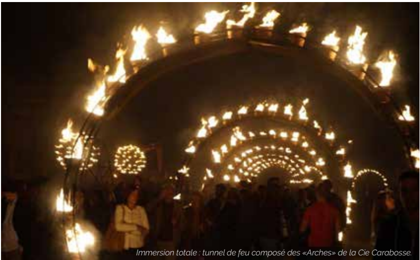
Immersion totale : tunnel de feu composé des «Arches» de la Cie Carabosse.