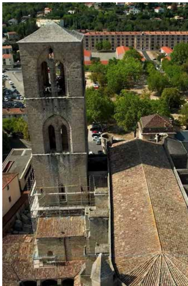
Projections des films documentaires du chantier