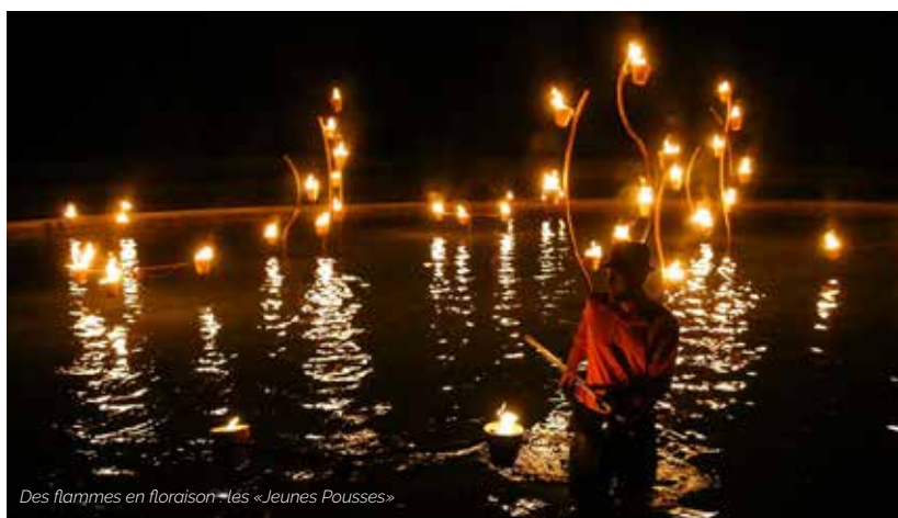
Des flammes en floraison - les «Jeunes Pousses»