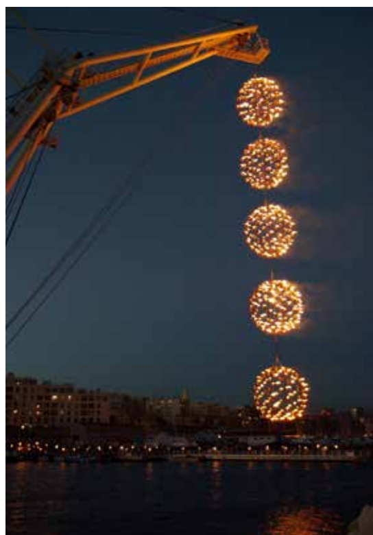
Les « Boules suspendues »

Chaque installation de feu est le fruit d'une écriture spécifique. Elle transforme les lieux et propose une expérience à vivre aux spectateurs. C'est une invitation au voyage que l'on partage dans un univers accueillant, devenu véritable espace de poésie et de liberté. Un parcours nocturne qui magnifie et transfigure les espaces. Une expérience artistique unique !