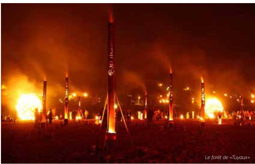
Le forêt de «Tuyaux»