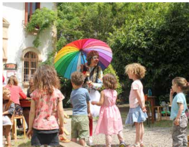
Animations par des acteurs locaux. Photo : Clown Caillette et la Cie des Jeux 2022