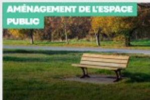
AMÉNAGEMENT DE L'ESPACE PUBLIC