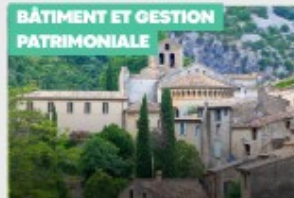
BÂTIMENT ET GESTION PATRIMONIALE