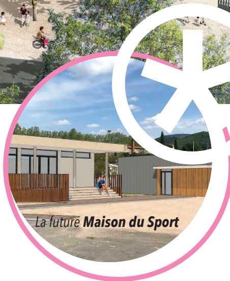
La future Maison du Sport

Ces travaux ont pour objectif de réaménager l'ensemble du site, en intégrant les enjeux liés aux espaces publics, au paysage, aux mobilités douces et à l'adaptation au changement climatique.