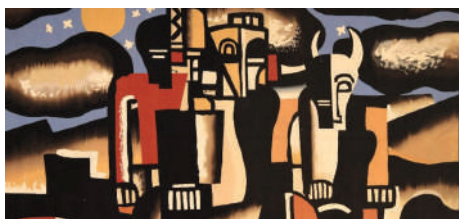
En haut (affiche) : Jean VEGGER, Le Petit Poucet, laine et soie, 1920, Mobilier national Ci-dessus : Fernand LÉGER, La création du monde, tapisserie, 1962, Mobilier national, ADAGP, Paris 2024